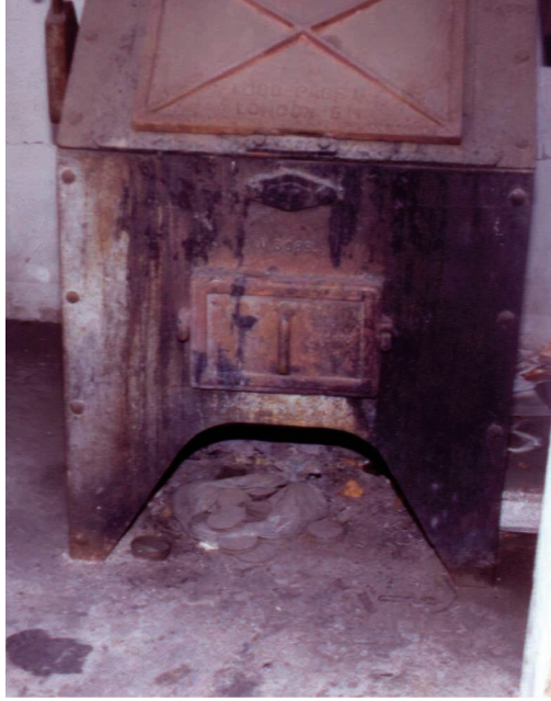
الشكل (١). صورة لمحرق قديمة .